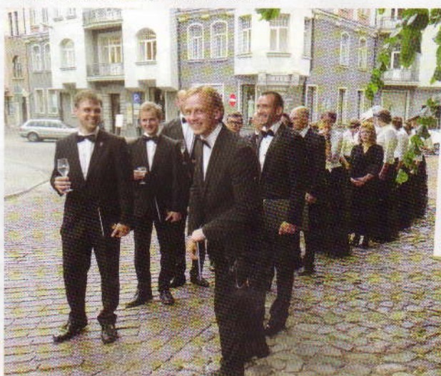
Koris "Pa saulei" iedziedas.