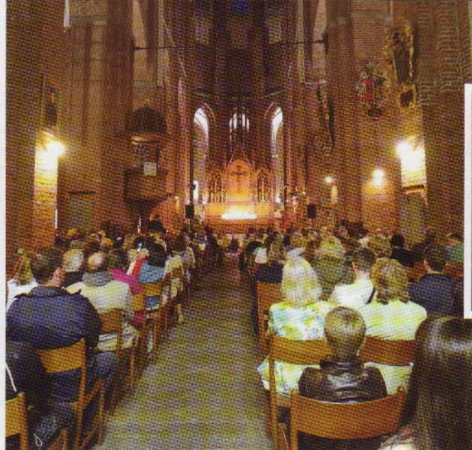
Baznīcu nakts noslēgums Pēterbaznīcā.