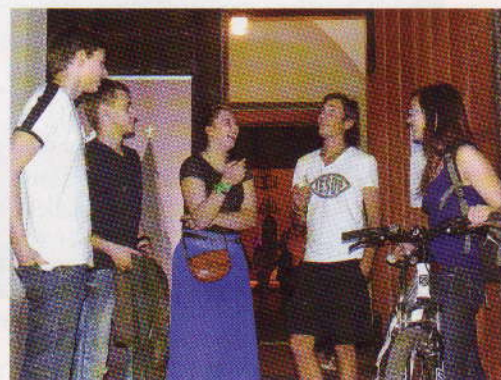
Pie Krusta draudzes.